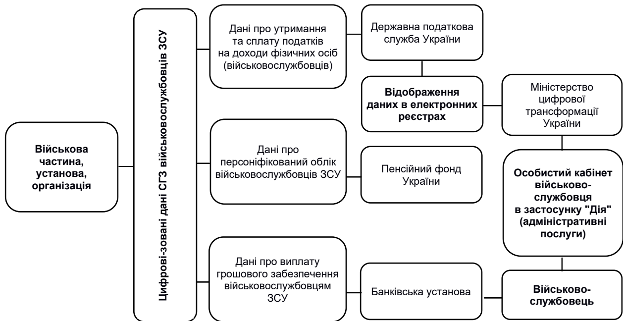
Рис. 2. Механізм надходження даних грошового та пенсійного забезпечення (карток особових рахунків) військовослужбовців ЗСУ до особистого кабінету в застосунку "Дія" (складено автором на основі джерел [7, 8, 12])

Механізм цифрової адаптації даних системи грошового забезпечення військовослужбовців ЗСУ з державними та банківськими установами та їхній рух до застосунку "Дія" (адміністративні послуги) наведено на рис. 2.