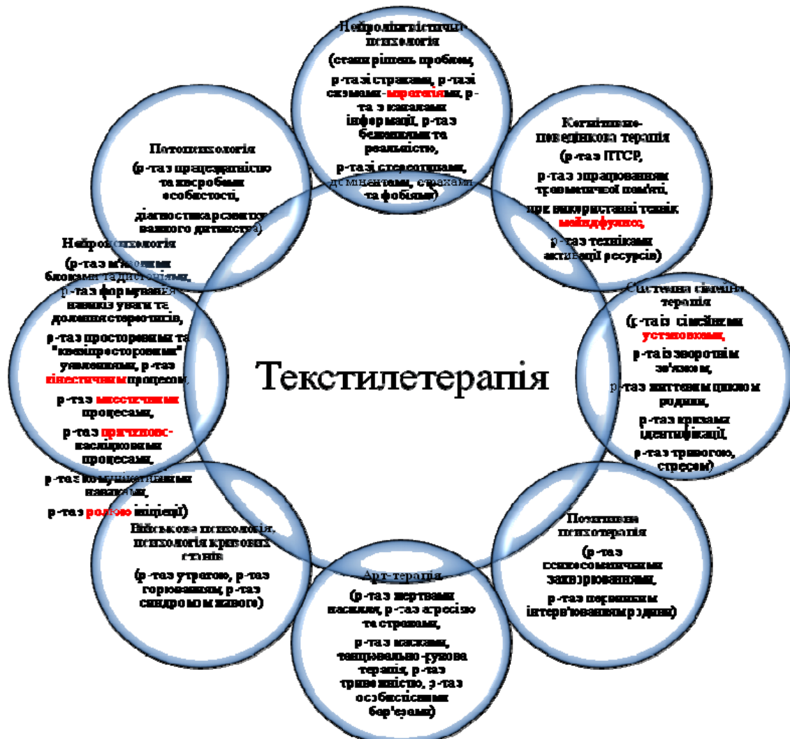
Рис.1. Взаємодія текстилетерапії з іншими психодіагностичними та психотерапевтичними напрямками психології